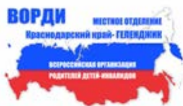
Городское общество инвалидов, г. Геленджик