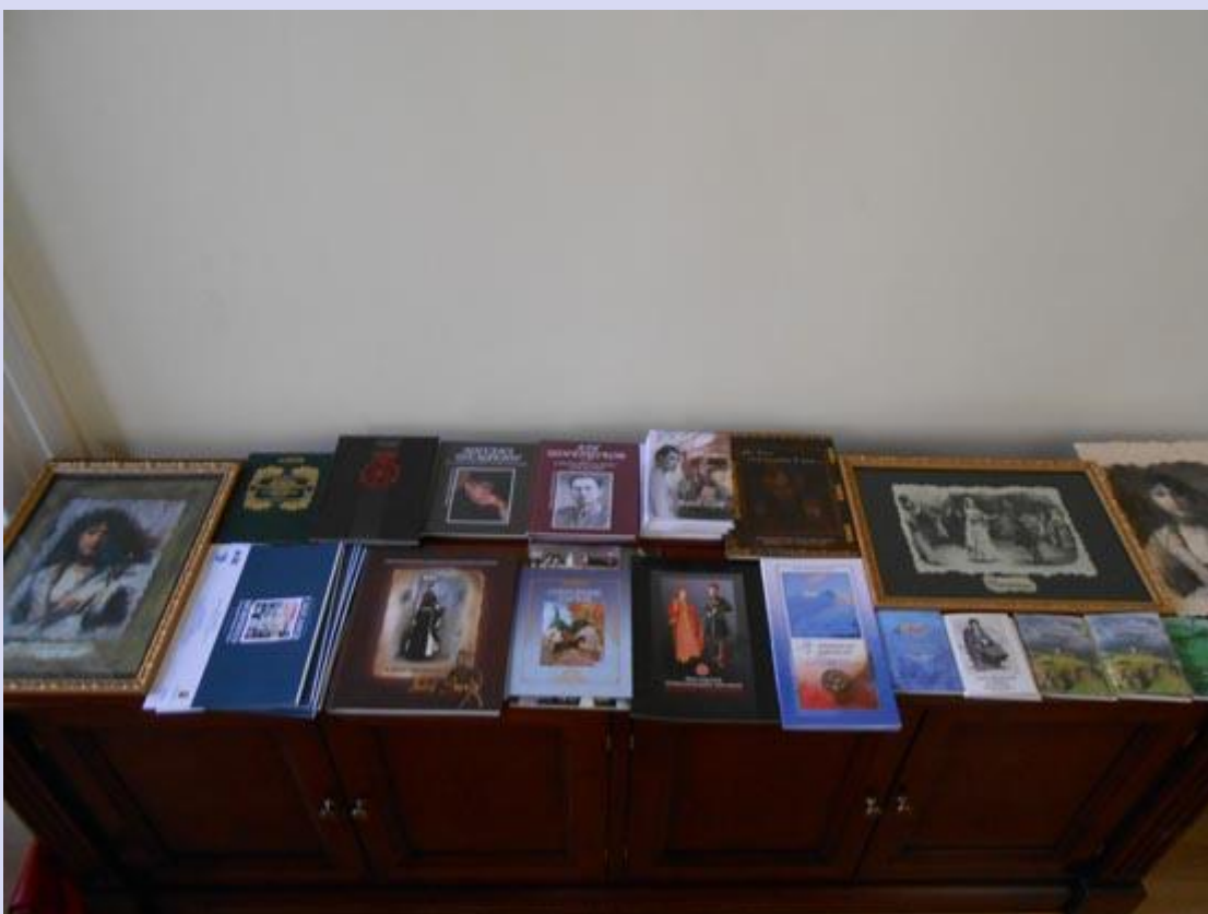
Выставка во Дворце Санта-Кроче