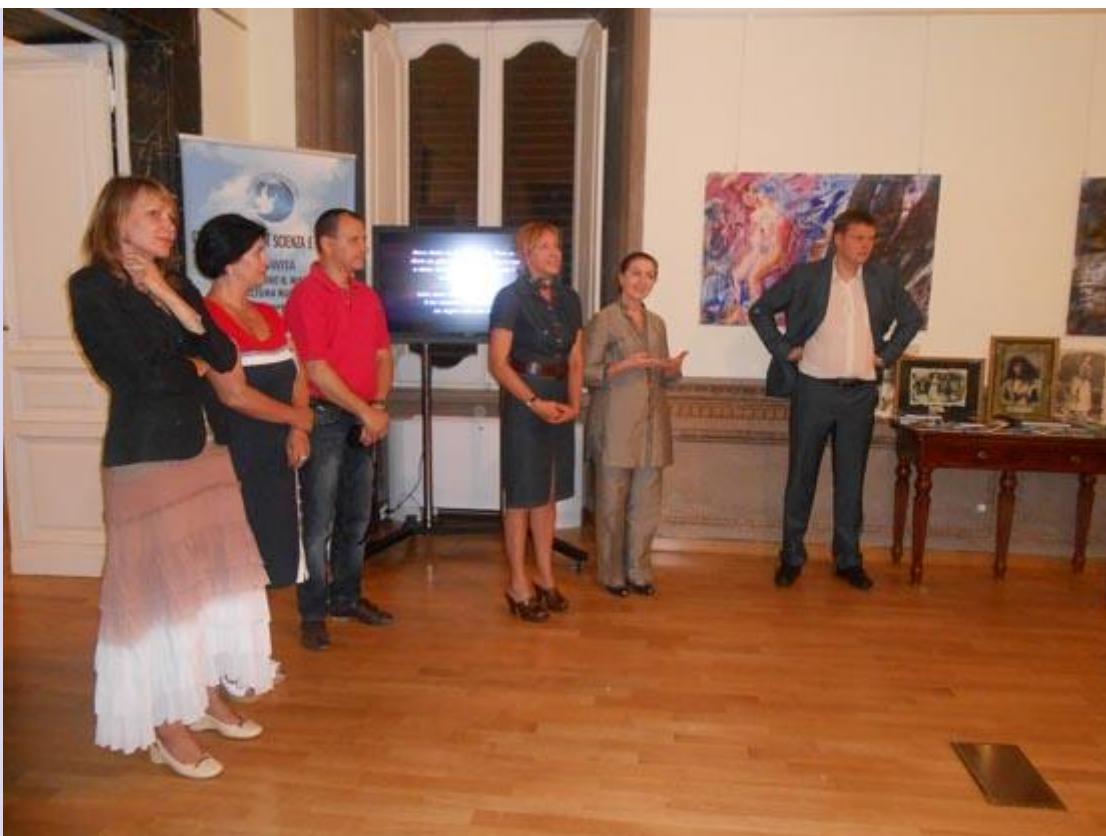
Выставка во Дворце Санта-Кроче, где находится Российский центр науки и культуры