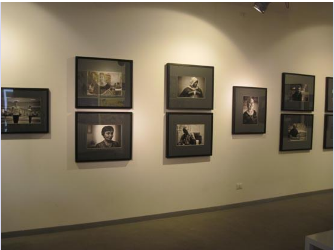
Выставка в центре фотографии (с 20-27 июля)