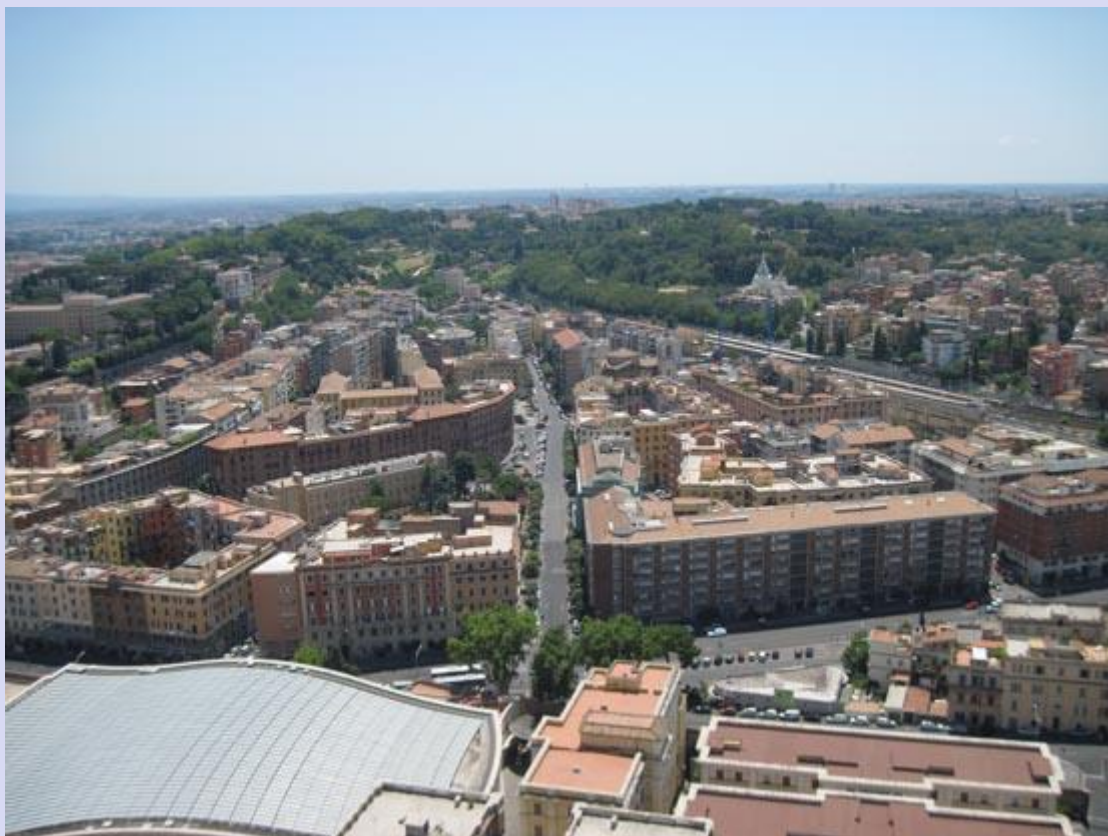
Рим с высоты Храма Сан-Пьетро

http://www.kavkaz-uzel.ru/articles/210300/