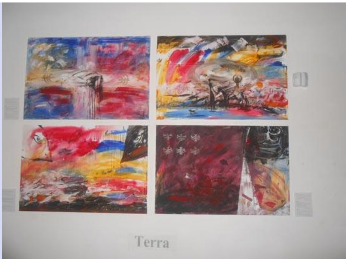
Выставка в центре фотографии. Картины Елены Асеевой