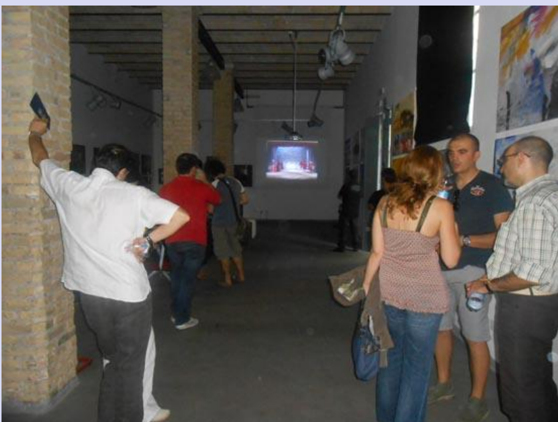
Итальянцы знакомятся с нашей выставкой